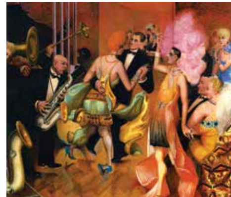
Otto Dix, détail de Großstadt (Triptychon), Galerie der Stadt Stuttgart.