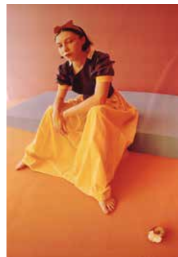
Pierre Joseph, Little Democracy , 1997, Collection IAC, Rhône-Alpes © Pierre Joseph.

du vendredi 19 septembre au vendredi 31 octobre du mardi au vendredi—14h à 19h, samedi—14h à 18h