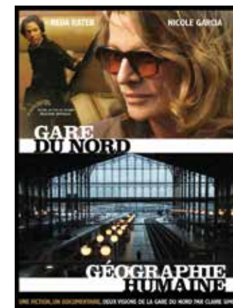
Géographie humaine/Gare du Nord © Les Films d'ici.