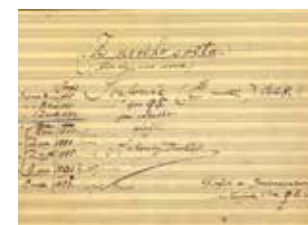
Page de titre du manuscrit de la Neuvième Symphonie de Dvořák.

Des rencontres en musique animées par Sophie Miczka , pour découvrir ou redécouvrir les œuvres ou compositeurs majeurs de la musique classique. samedi 18 octobre : Heiter Villa-Lobos, Astor Piazzola et autres compositeurs d'Amérique du Sud. samedi 15 novembre : lumière sur la Symphonie du Nouveau Monde du compositeur tchèque Antonin Dvořák.