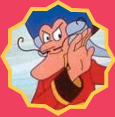
Les fabuleuses aventures du légendaire baron de Münchhausen © Films Jean Image.

Les enfants sont invités à découvrir des films et à parler de cinéma. Des histoires de loups loufoques, les aventures d'un baron fanfaron, une séance où l'on vote pour son film préféré, Noël en compagnie d'un célèbre duo du dessin-animé !