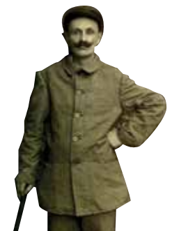
Anthelme Mangin.

Maison du livre, de l'image et du son vendredi 21 novembre