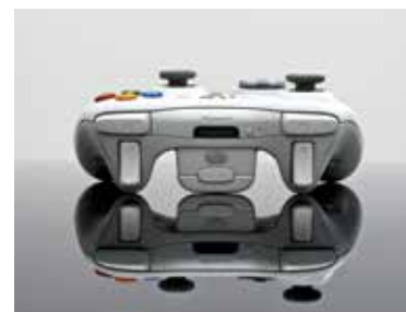
Xbox jeu poignée divertissement heureux blanc.

Maison du livre, de l'image et du son samedi 15 novembre—18h