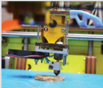
Printing with a 3D printer at Makers Party Bangalore.

Une maquette de la médiathèque est réalisée à partir d'une imprimante 3D prêtée par l'IUT B Lyon-Villeurbanne. Découvrez le fonctionnement, les applications et les possibilités de cette technologie innovante qui permet la création d'objets par superposition de fines couches de plastique.