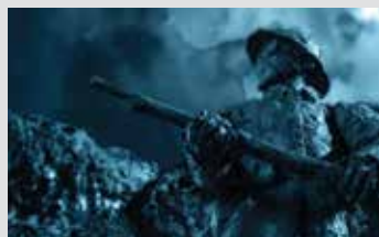
Erano Collet, Le jour de gloire

Une après-midi dédiée aux films courts qui mêle étroitement fiction et réalité.