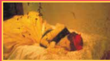
Pierre Joseph, Blanche-Neige (Personnage à réactiver) , 1992. Collection IAC, Rhône-Alpes © André Morin.

Maison du livre, de l'image et du son samedi 4 octobre—15h30 à 16h45 sur inscription DE 4 À 6 ANS