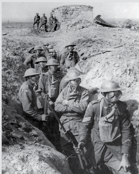
Australian infantry wear gas respirators, Ypres 1917, Public domain, Frank Hurley, Collection Database 1917.

Maison du livre, de l'image et du son samedi 22 novembre