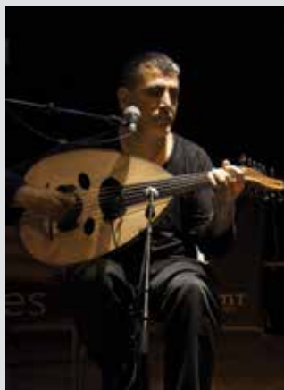
Bab Assalam

Médiathèque du Tonkin samedi 22 novembre—15h30 sur réservation